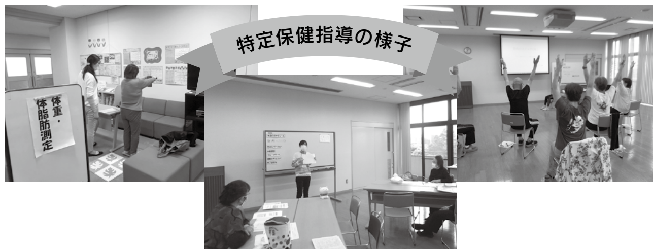
特定保健指導の様子

米子市保険課 TEL(0859)23-5122(保険証、後期高齢者医療等) 23-5121(高額療養費等) 23-5407(健康診査、保健指導等) 米子市収納推進課 23-5124(納付相談等) 23-5161(口座振替等)